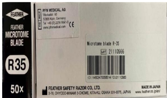
PRODUCTO NO CONFORME

Si tienen conocimiento de algún incidente relacionado con el uso de un producto sanitario, notifíquelo a través del portal NotificaPS de la AEMPS. Vuestra colaboración notificando es esencial para tener un mayor conocimiento de estos productos y velar por su seguridad.