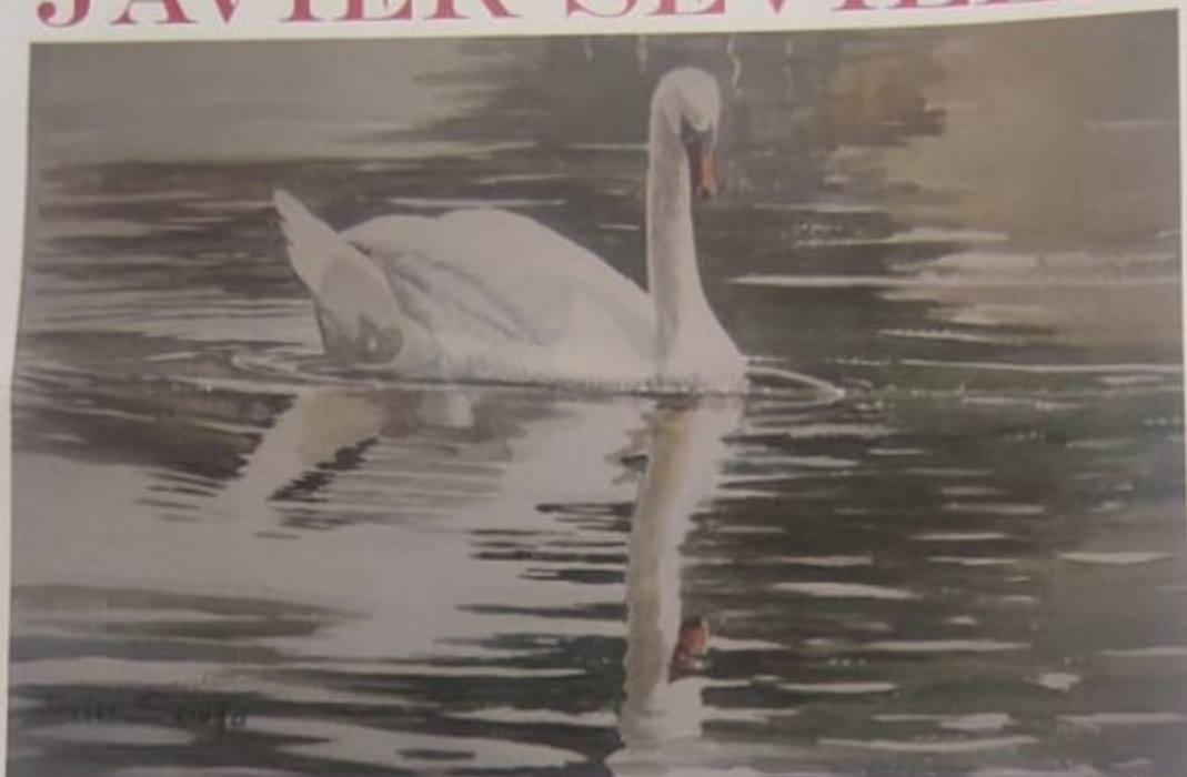
Cisne de la Grajera