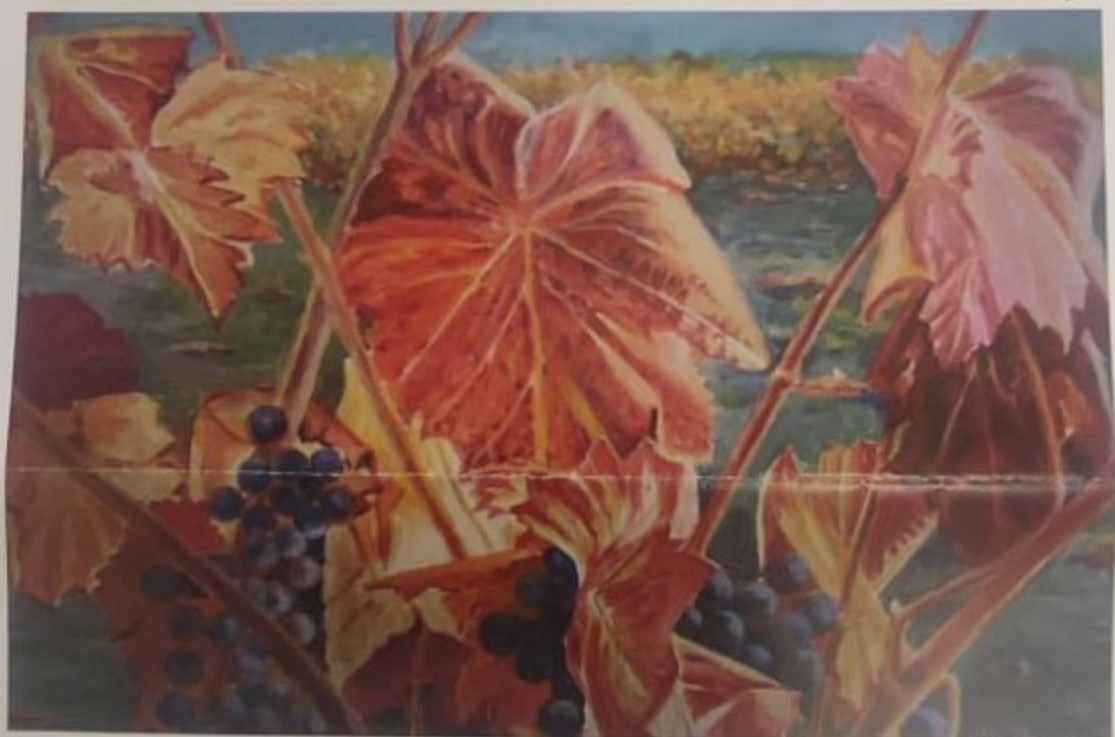
Viña de Logroño