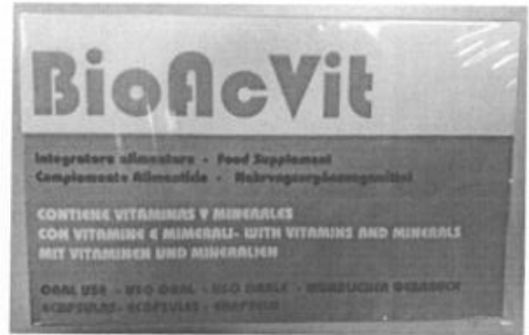
Fig.1: Imágenes del producto BIOACVIT CÁPSULAS.