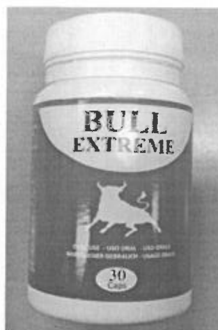
Fig.7: Imágenes del producto BULL EXTREME CÁPSULAS.