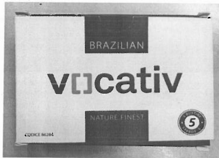
Fig.1: Imagen del producto VOCATIV SOBRES.

La prohibición de la comercialización y la retirada del mercado de todos los ejemplares del citado producto.