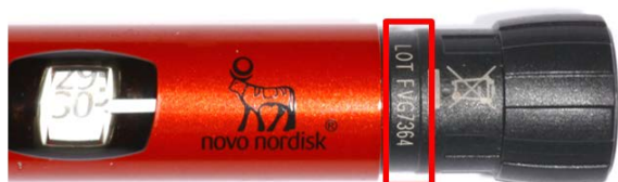
Figura 2. El cuadro rojo indica la ubicación del número de lote en NovoPen® Echo®. Por ejemplo, el número de lote de NovoPen® Echo® es FVG7364.

El número de lote está impreso en los dispositivos NovoPen® Echo® tal y como se indica a continuación (Figura 2).