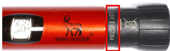
Figura 2. El cuadro rojo indica la ubicación del número de lote en NovoPen® Echo®. Por ejemplo, el número de lote de NovoPen® Echo® es FVG7364.

El número de lote está impreso en NovoPen® Echo® tal y como se indica a continuación (Figura 2).